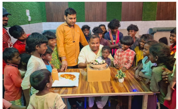
रेस्टोरेंट में इंट भट्ठा मजदूरों के बच्चों के साथ जन्मदिन की खुशियां केक काटकर मनाते संस्था के सदस्य।

श्री मुरली वाला युवा सेवा समिति समाज के आर्थिक, शैक्षणिक, नैतिक, सामाजिक, सांस्कृतिक विकास हेतु विभिन्न कार्यक्रमों का संचालन करती है। वहीं जरूरतमंद लोगों को आत्मनिर्भर बनाने में संस्था सहयोग प्रदान करती है। गरीब कन्याओं की शादी कराने, दिव्यांग प्रभुजनों के साथ ही जरूरतमंदों की सहायता करने का जो बीड़ा संस्था ने उठाया है वह समाज को नई दिशा देने का काम कर रहा है।