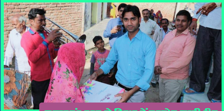
जरूरतमंद बहन के विवाह में सहयोग करती टीम