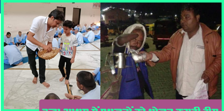
वृद्धा आश्रम में प्रभुजनों को भोजन कराती टीम