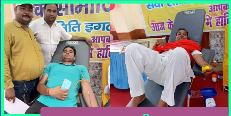
रक्तदान जीवन दान, महादान