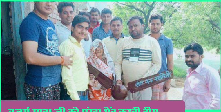
बुजुर्ग माता जी को पंखा भेंट करती टीम