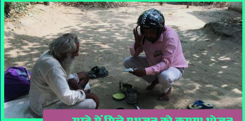
रास्ते में मिले प्रभुजन को कराया भोजन