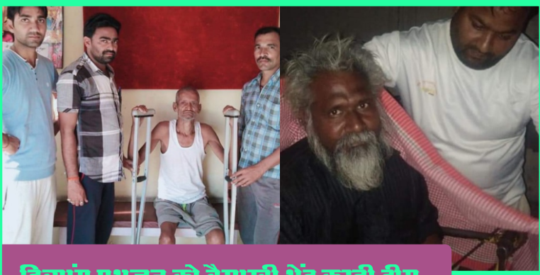
दिव्यांग प्रभुजन को बैसाखी भेंट करती टीम