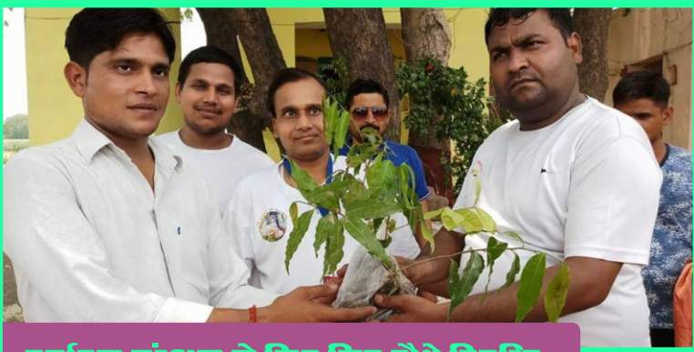
पर्याचण संरक्षण के लिए किए पौधे वितरित